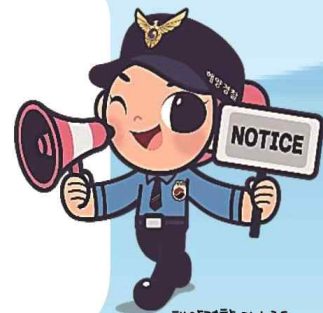
해양경찰 마스코트 '해누리'