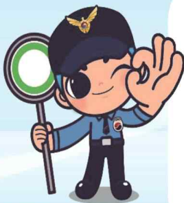
해양경찰 마스코트 '해우리'