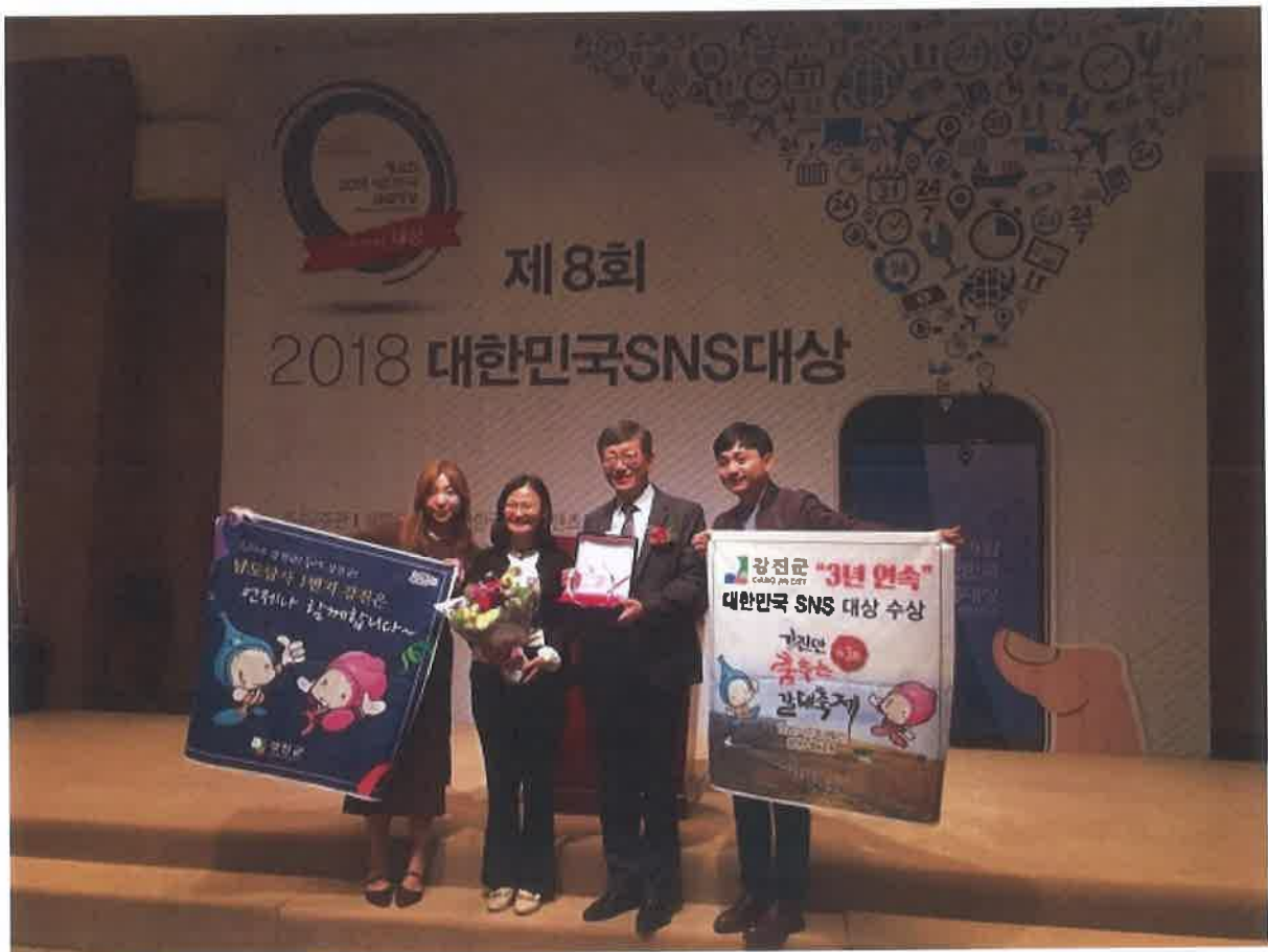
▲강진군이 최근 대한민국 SNS 대상을 수상했다.

[전남=내외뉴스통신] 이범용 기자=전남 강진군이 헤럴드경제와 (사)한국소셜콘텐츠진흥협회가 공동주최한 제8회 대한민국 SNS 대상 시상식에서 기초지자체 군 부문 대상(大賞)을 수상했다.