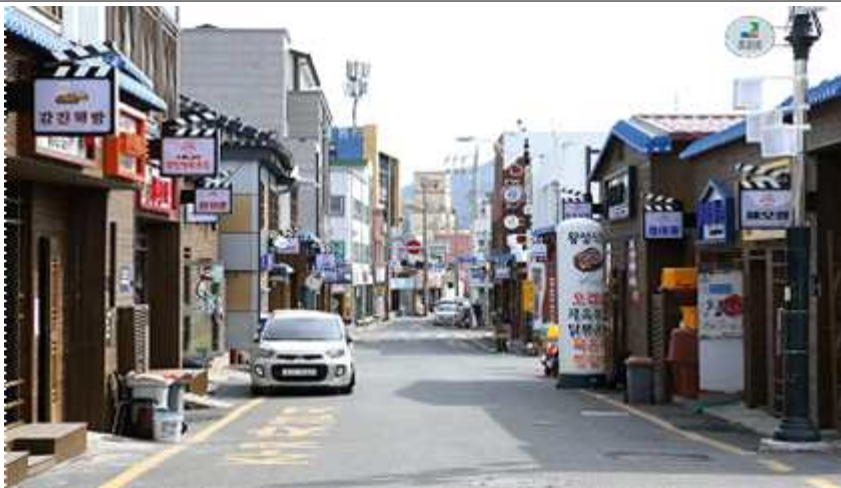
< 골목길 전경 >