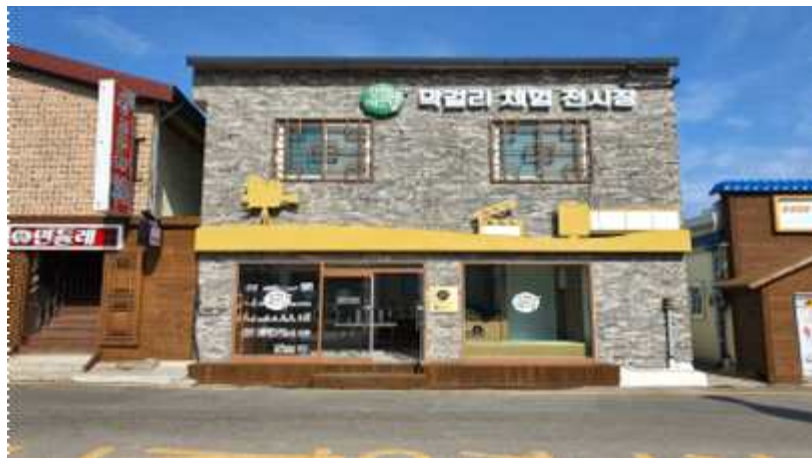
< 체험장 조성 >