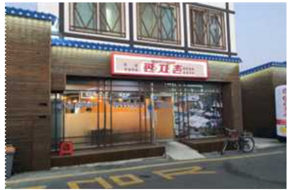
< 간판 및 파사드 정비 >