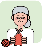
고령자 및 독거노인