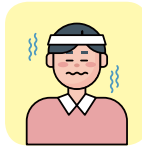
만성질환자 (고혈압, 심장병, 당뇨, 뇌졸중 등)