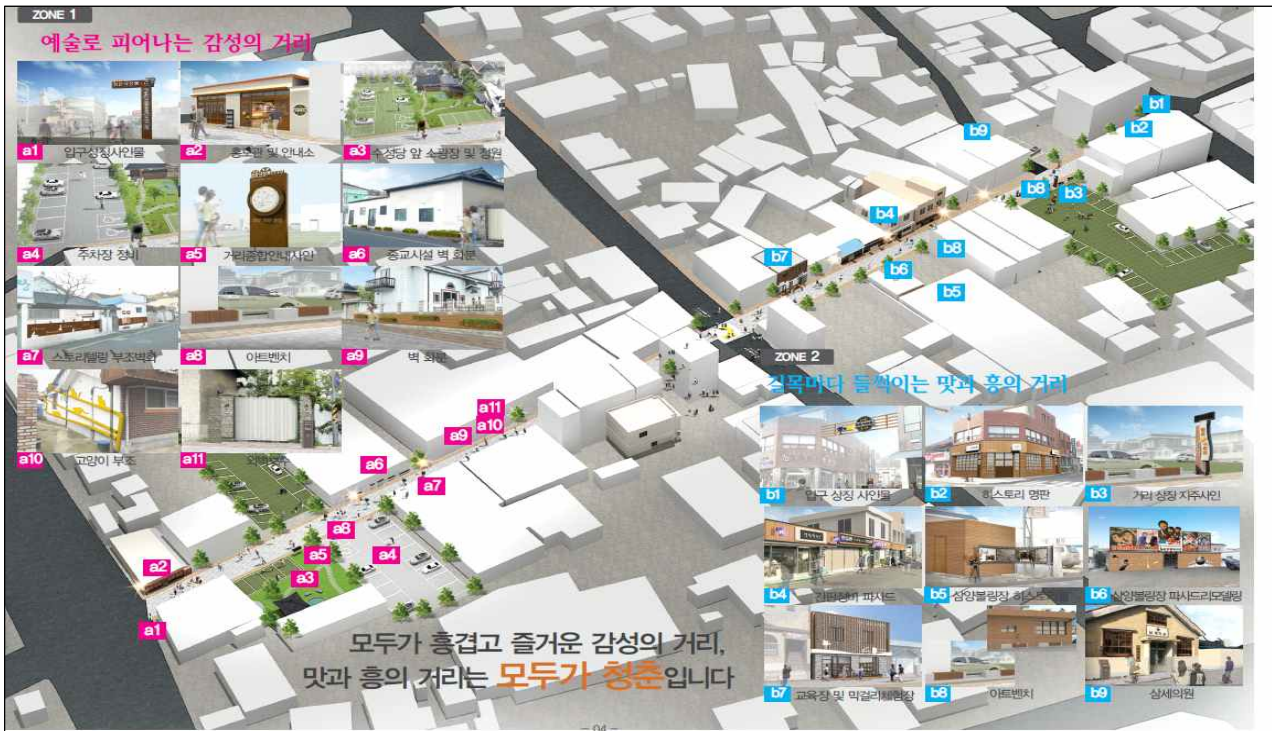
조감도 (남문슈퍼 ↔ 카페베네)