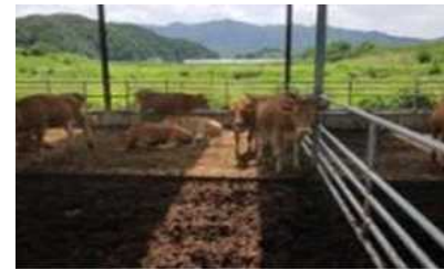
▲ 개방형 축사