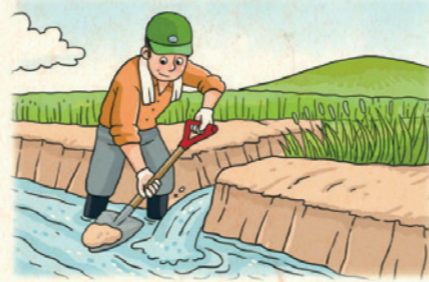
| 침 · 관수 벼 흙양금 및 오물세척 효과(감수율) |