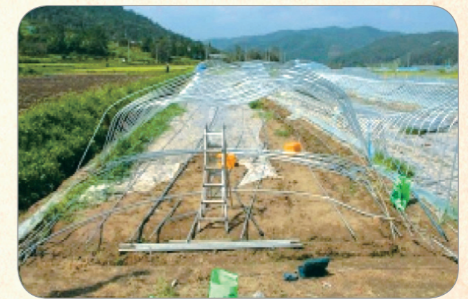
[일반 피해 하우스]