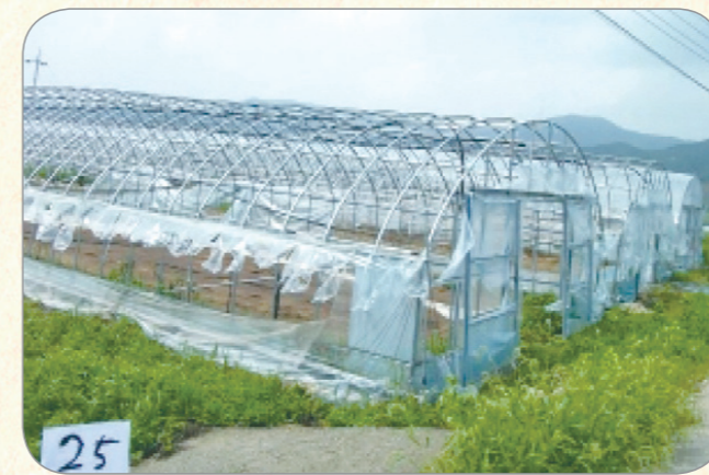
[비닐 사전 제거 하우스]