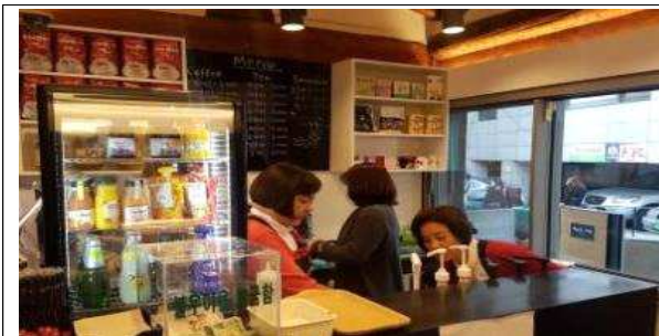
백남준 카페 운영