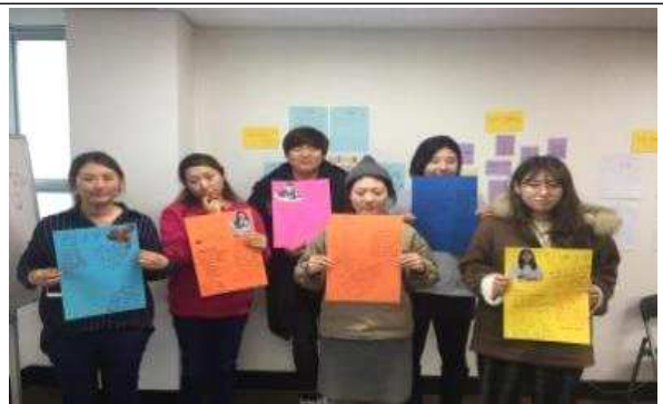
뉴딜일자리 활동가 교육