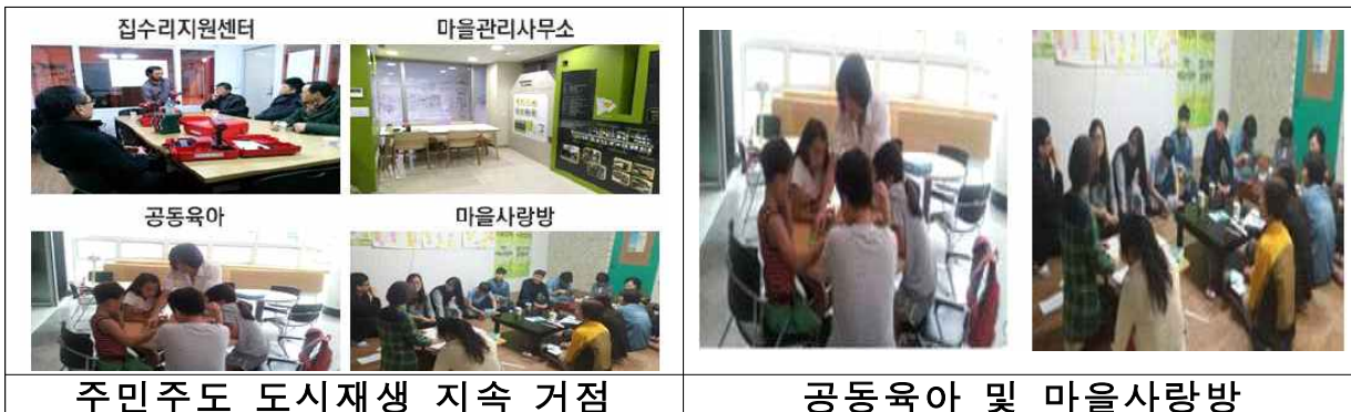
< 서울 구로구 주민공동이용시설 >