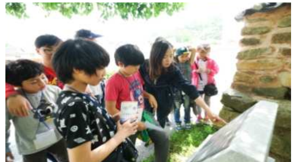
공정여행 프로그램 천천희