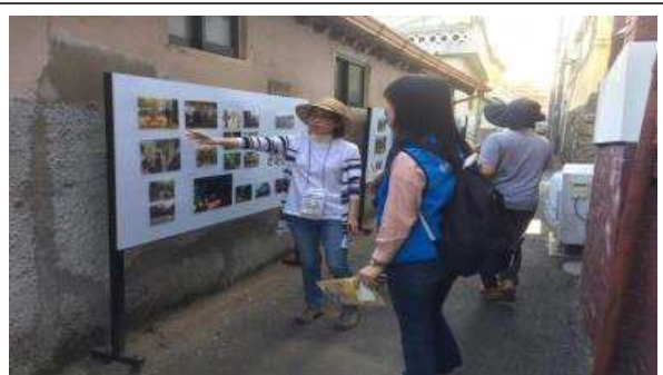
골목길 투어 중