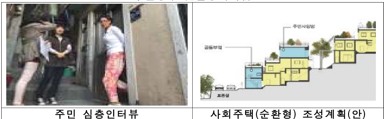
< 부산중구 햇살등지사업 >