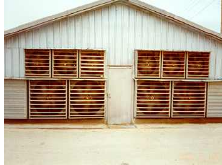
<계사 환기팬 설치>

※ 축사 내 환기팬 또는 송풍팬의 설치는 풍속을 증가시켜 가축의 체감온도를 낮출 수 있을 뿐 아니라 젖소의 경우 산유량도 증가시킴(표 3)