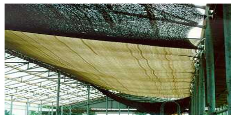
<축사지붕 및 축사 내 차광막 설치>