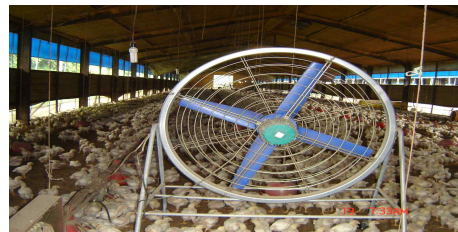
(개방 계사 릴레이 순환 환)