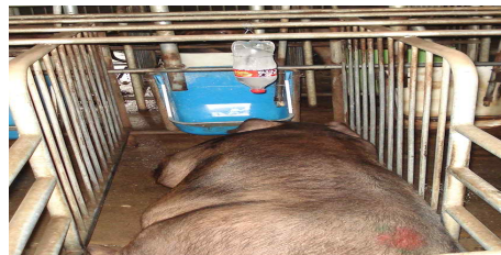
<페트병을 활용한 점적관수>