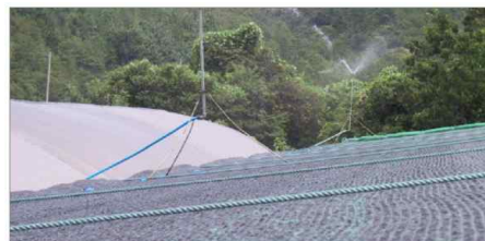
<축사 지붕 위 물 분사>