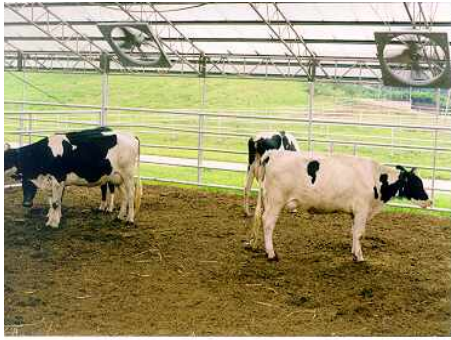
<우사 송풍팬 설치>