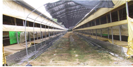
<계사 서향에 그늘막 설치>