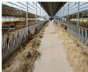
<지붕 차광망 설치>