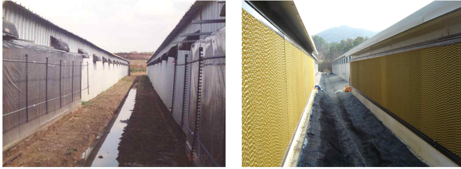
<무창계사 쿨링패드 설치>

※ 무창계사에서 쿨링패드 설치에 의한 계사내부 온도는 외부온도가 33℃일 경우 입기온도는 27.4℃이고 배기구의 온도는 29.8℃로 감소하지만 습도는 다소 높아짐(표 4).