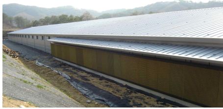
<쿨링 패드 가동장면>