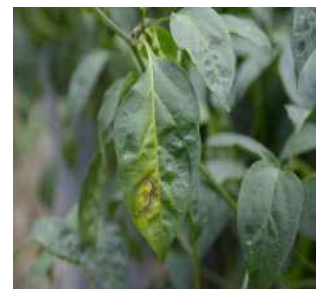
【국화 하우스 주변 고추 잎 괴사반점】