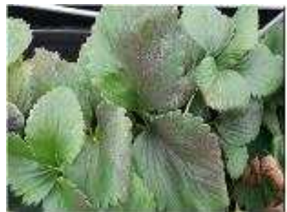
【온실가루이 그을음 피해】