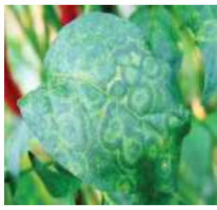
【다중 원형반점 증상】