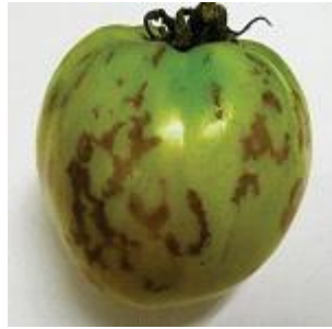
【괴저 원형반점 증상】