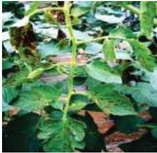
【잎 괴저반점 증상】