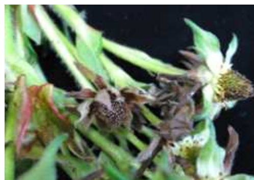
【딸기 꽃곰팡이병 증상】