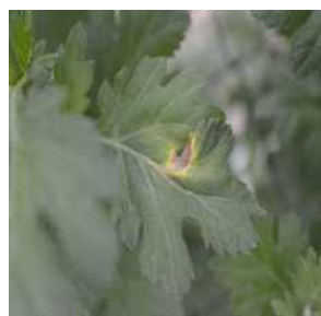
【잎의 괴사반점 증상】