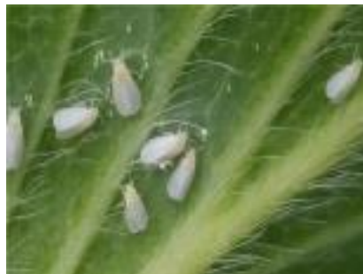
【온실가루이 성충과 알】