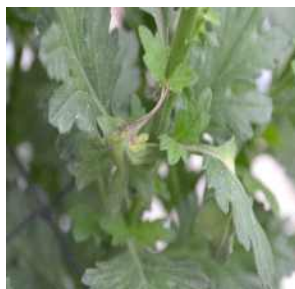
【잎자루의 괴사 증상】