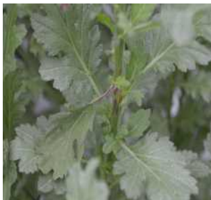
【줄기의 괴사 증상】