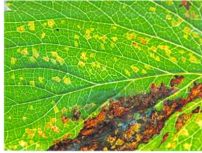
【후기 잎 증상】