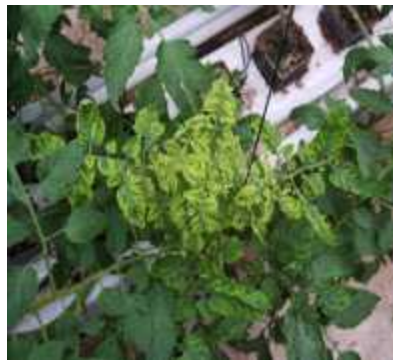
【토마토 TYLCV 증상】