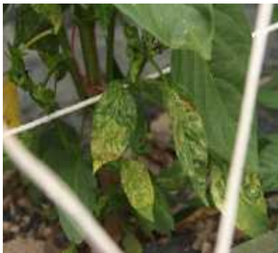
【고추 TSWV 증상】

⇒진딧물 방제를 철저히 하고 작물이 시설 내에 연중 재배되어 항상 전염원은 있으므로 즙액에 의한 접촉전염을 막기 위해 병든 식물체는 즉시 제거