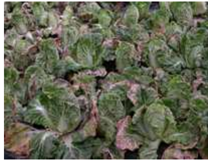
【노균병 피해 포장】