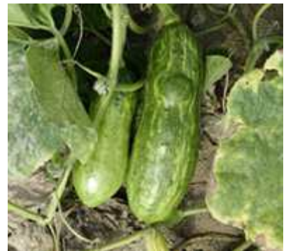
【호박 ZYMV 증상】