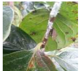
【갈색날개매미충 및 감나무 산란】