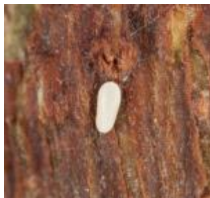
【미국선녀벌레 성충 및 알】