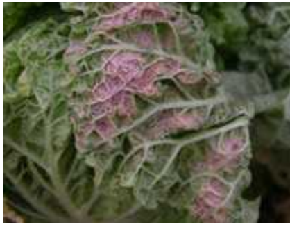
【배추 노균병 증상】