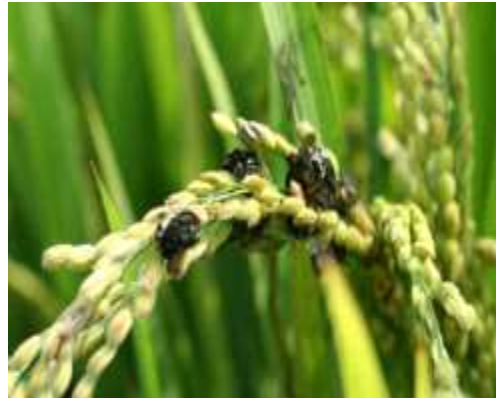
【이삭누룩병 후기 증상】