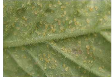
<담배가루이 약충 및 번데기>

☞ 총채벌레와 담배가루이는 직접적인 피해뿐만 아니라 토마토반점위조병, 토마토황화잎말림병 등을 매개하기 때문에 노란색 끈끈이트랩을 설치하여 발생초기에 적용약제를 즉시 살포