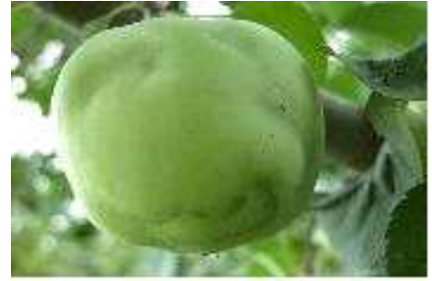
<복숭아 심식나방 피해과>