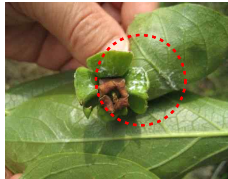
<단감열매 미국선녀벌레 발생>