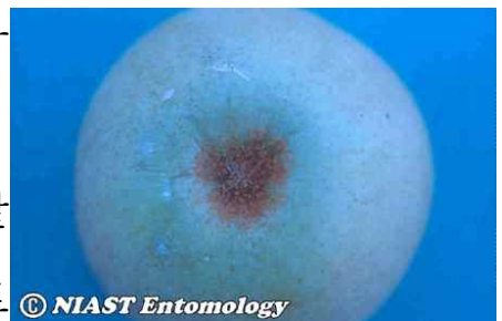
<사과 과실로 이동한 점박이응애 월동충>