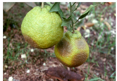
<감귤류 역병 피해증상>