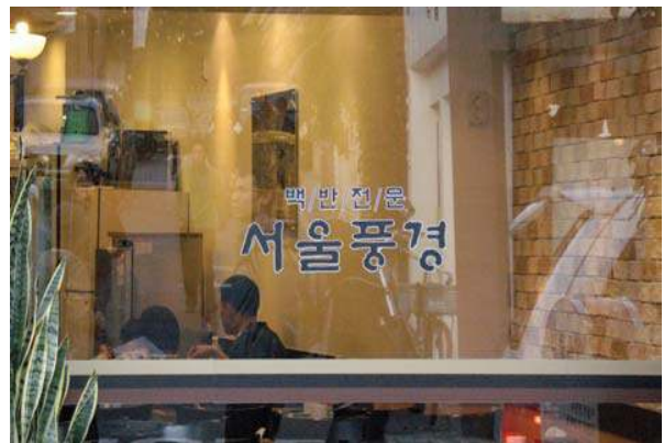
업소명을 무채색으로 간결하게 적용한 사례