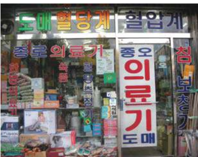
매장 전면을 원색 광고문구로 가득 채우는 경우