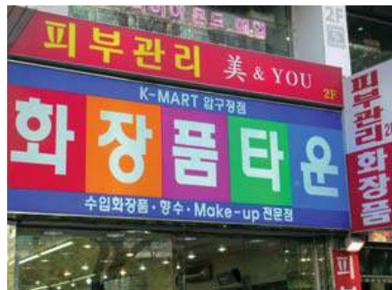
지나치게 많은 원색을 사용