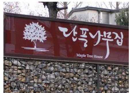
캘리그래피로 표현한 예