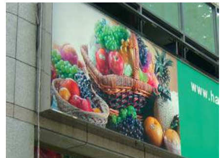
원색적인 대형 광고 이미지 사용