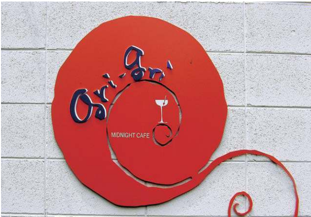
빨간색을 포인트로 사용하여 재미있고 매력적인 인상을 주는 주점