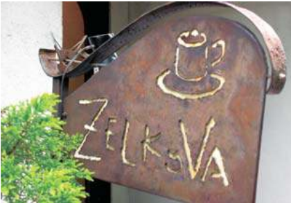
재질 고유의 자연스러운 색상 사용