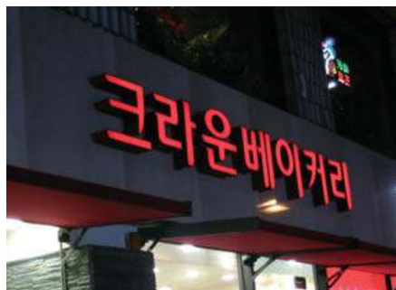
전용서체를 개발한 예