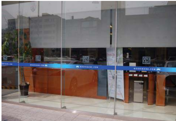
안전띠 개념으로 로고를 간결하게 적용한 창문이용 광고물

창문이용광고물은 창문 또는 출입구에 직접 부착하는 형태로 표시한다. 상호 또는 브랜드명외에 전화번호, 영업내용 등을 높이 20cm이하로 간략하게 표시한다.