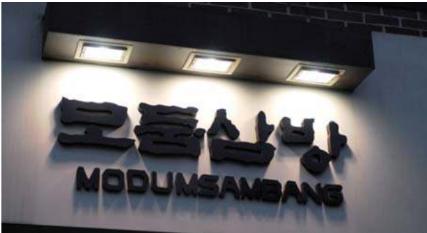
위에서 아래로 비추는 외부조명방식의 간판