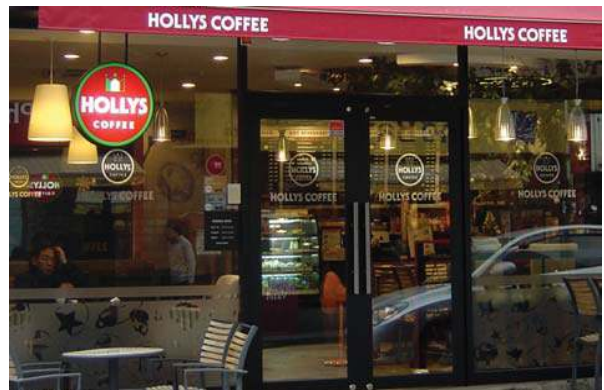
로고를 간결하게 적용하고 하단을 에칭시트로 그래픽 처리한 사례