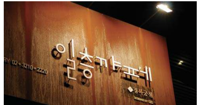
앞쪽에서 문자를 비추는 외부조명방식의 간판