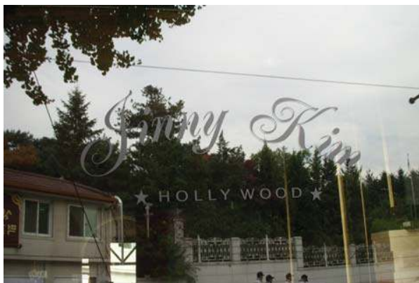
출입구 부분에 깔끔하게 로고를 적용한 사례