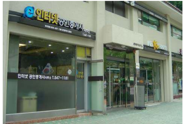
저채도 색상의 안전띠를 간결하게 적용한 창문이용 광고물