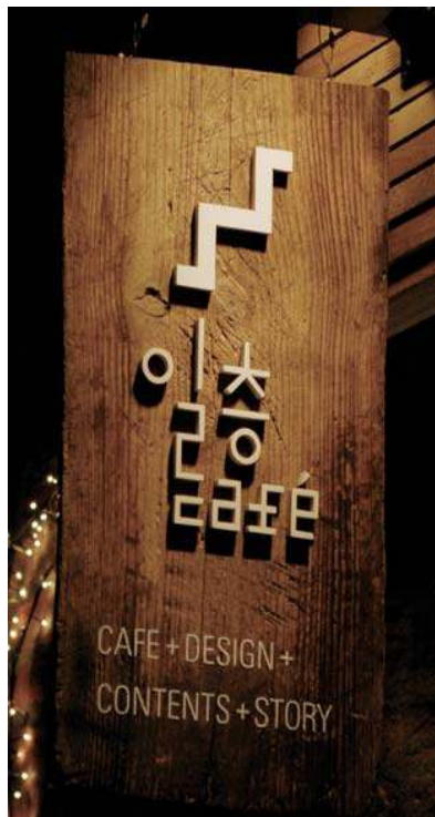
건물의 외부 마감재와 어울리는 색상 사용