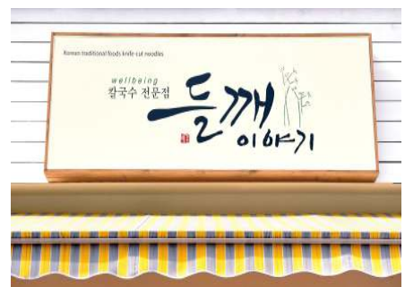
2009 서울시 좋은간판 대상