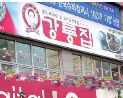
직접 광고문구와 실물 광고사진을 이용한 간판