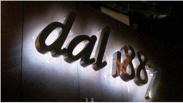
은은한 느낌의 간접조명방식

부드럽고 은은한 간접조명방식으로 세련된 분위기를 연출하거나 입체문자를 외부에서 조명하여 오브제의 조형미를 돋보이게 한다. 내부조명을 사용할 경우라도 문자나 도형 부위만 부분적으로 조명을 사용한다.