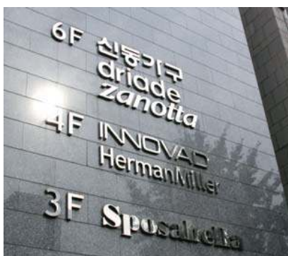
건물의 분위기와 어울리는 재질 사용