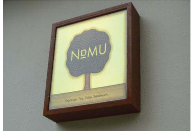
노란색과 갈색을 사용하여 따뜻하고 편안한 느낌을 연출한 카페