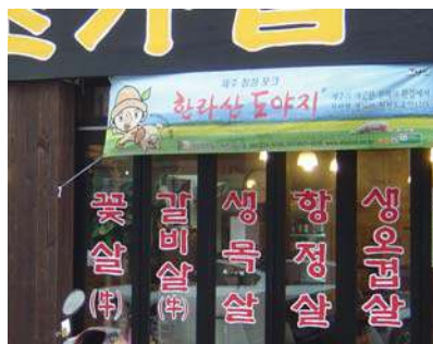
차림표, 영업내용 등을 지나치게 크게 표기한 경우