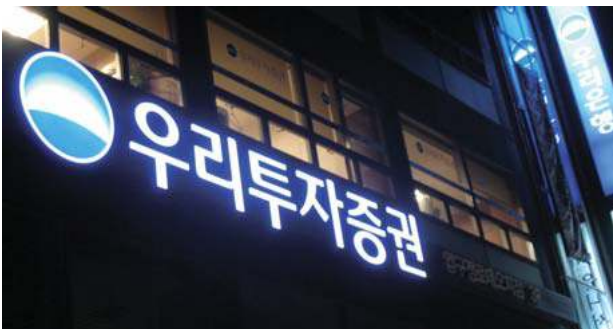
입체문자에 조명을 매입하여 문자 자체에서 빛이 나오는 간판