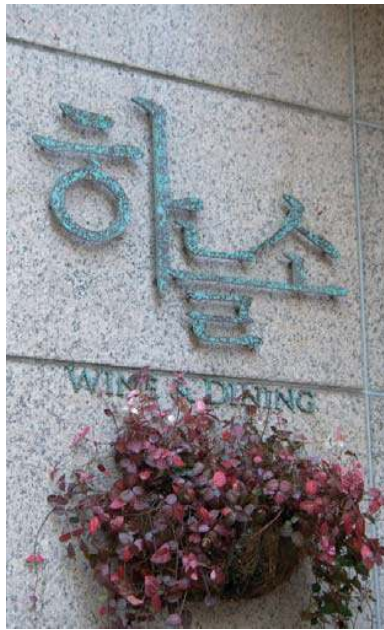
건물의 외부 마감재와 어울리는 재료 사용

업소의 특성을 전달할 수 있는 효과적인 재질을 사용하되, 지역 특성을 반영할 수 있고 건축물의 외부 마감재와 조화로운 재질을 사용한다.