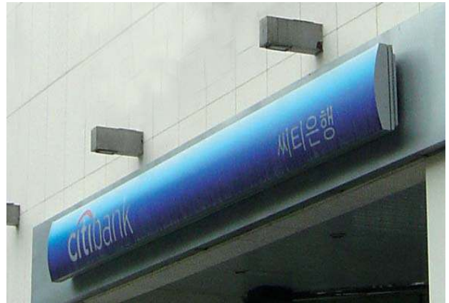
파란색을 사용하여 은행의 신뢰성, 안정성을 표현한 금융업소