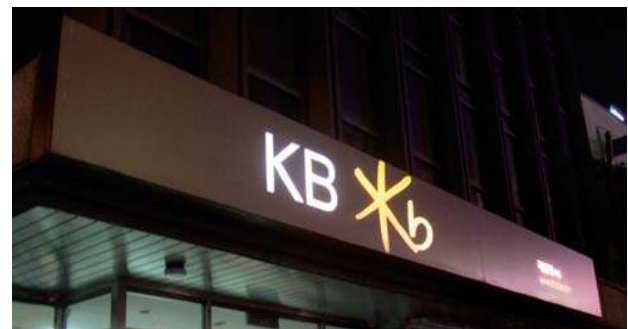
문자 및 도형 부위에만 빛이 나오는 부분조명방식의 판류형 간판