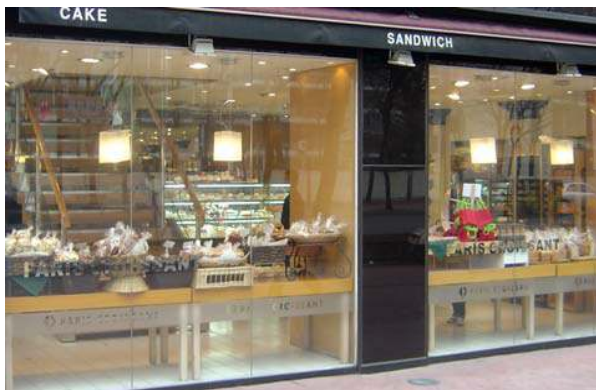
반투명 에칭시트와 부분적인 로고 적용으로 창문의 개방감 유지