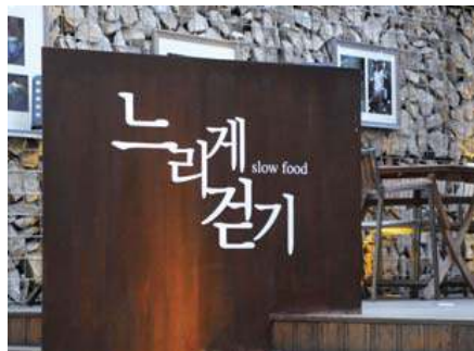
일반서체를 가공한 예