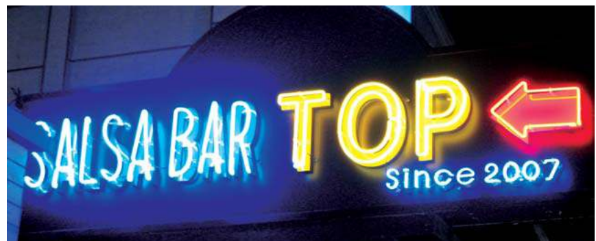
지양사례 2 - 광원이 노출된 점멸방식의 조명