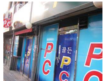
창을 완전히 가리고 광고면으로 활용하는 경우