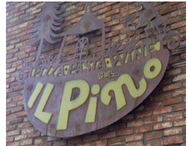
건물의 외부 마감재와 어울리는 색상 사용