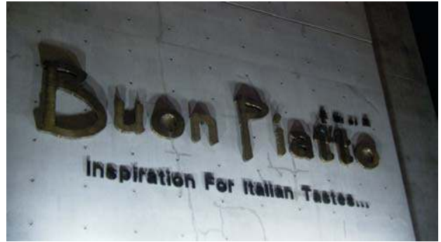
아래에서 위로 비추는 외부조명방식의 간판