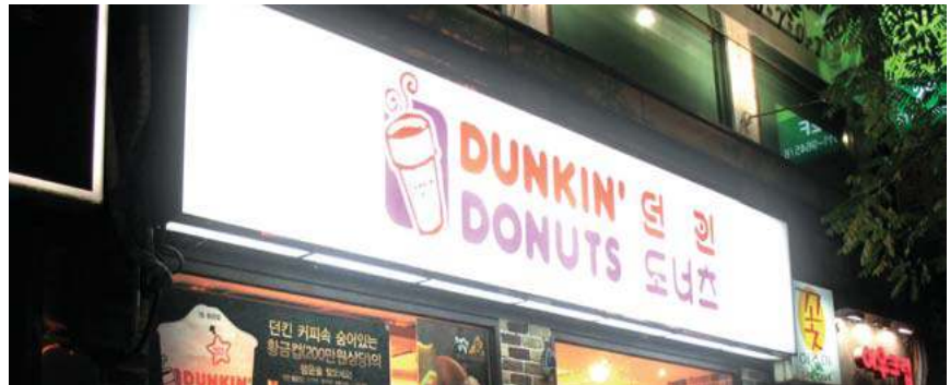
지양사례 1 - 판류형 간판 전체에 빛이 나오는 내부조명방식의 간판

너무 밝거나 눈이 부시게 자극적인 조명은 빛 공해를 유발시키고 정보전달력을 떨어뜨린다. 시각적으로 부드럽고 편안한 조명 사용을 권장하고 광원이 직접 노출되는 조명, 점멸하는 조명은 지양한다.