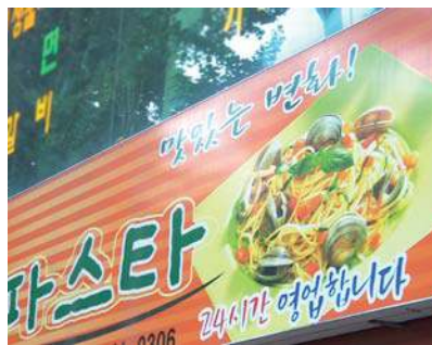
직접 광고문구와 실물 광고사진을 이용한 간판