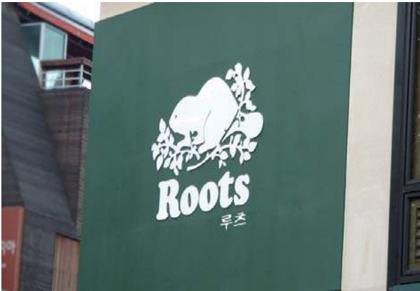
녹색을 사용하여 자연스럽고 편안한 느낌을 주는 캐주얼 의류업소