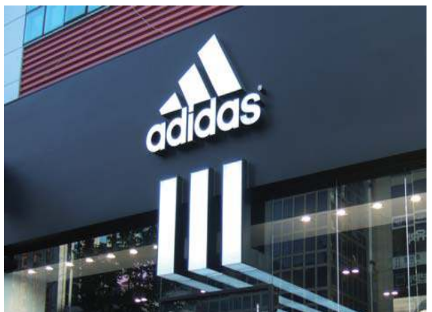
검정과 흰색의 대비를 통해 세련된 느낌을 연출한 스포츠 매장