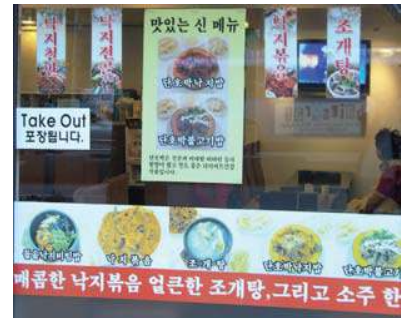
차림표와 실물 광고사진으로 뒤덮인 창문