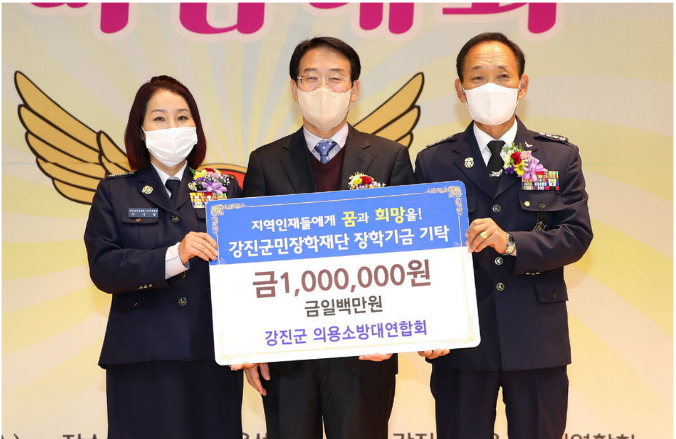
강진군 의용소방대 연합회 백만 원 장학금 기탁

지난 11월의 마지막 날, 강진군 의용소방대 기술경연대회가 강진군 종합운동장 제1실내체육관에서 열렸다.