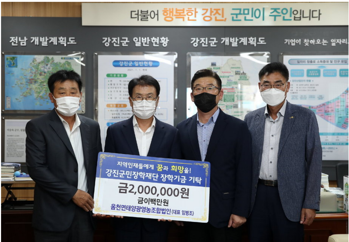
옴천면태양광영농조합법인, 장학금 200만원 기탁