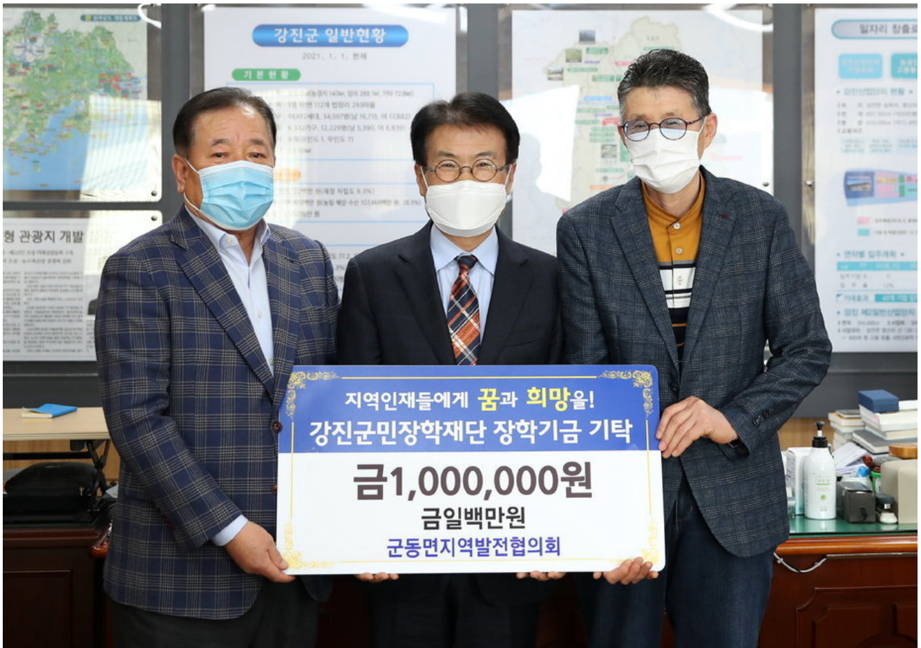
군동면지역발전협의회 100만원 장학금 전달

지난 16일 군동면지역발전협의회(김재신 회장)가 100만 원을 강진군민장학재단(이사장 이승옥)에 장학금으로 기탁했다.