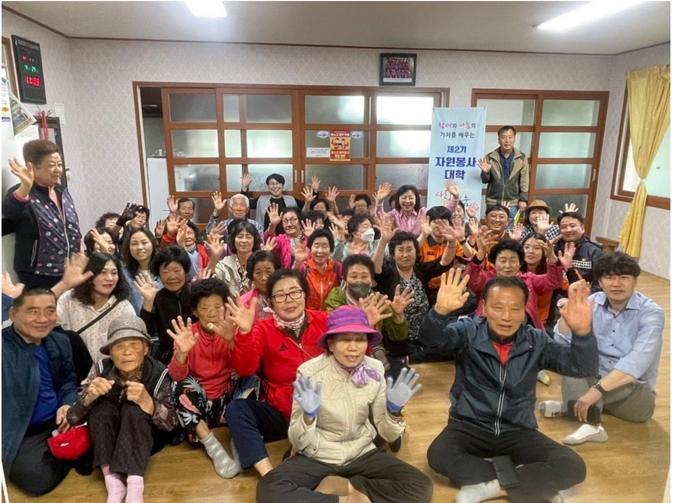
강진군 '제2기 자원봉사대학', 생활 속 안전 자원봉사 실습 군동면 평리마을 찾아가 자원봉사활동 교육

지난 24일 제2기 자원봉사대학 수강생 20명은 군동면 평리마을을 찾아 생활 속 안전 교육을 통한 역량강화 프로그램을 실시했다.