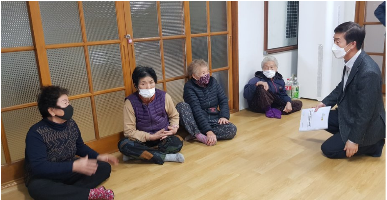
강진 작천면 부흥마을 경로당 '공동생활의 집 공모사업' 선정

강진군 작천면이 전라남도가 주관한 '2021 공동생활의 집 공모사업'에 작천면 부흥마을 경로당이 선정되어 4천만 원을 지원받는다.