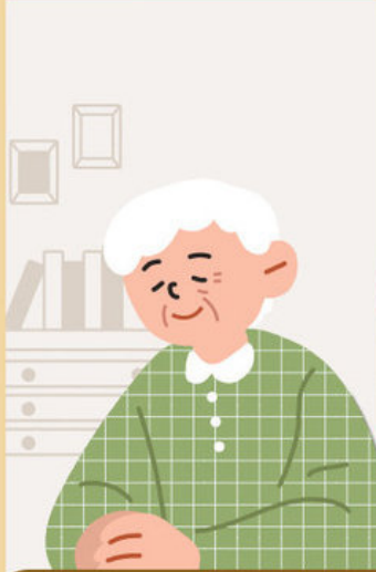
① 독거노인 등 취약계층