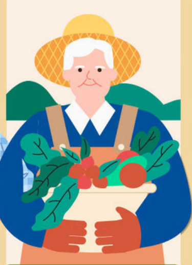
③ 고령층 논밭 작업자