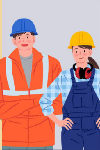
② 공사장 야외근로자