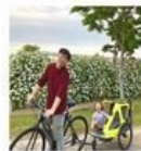
화창한 봄날! 아빠~살려요!