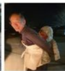
할아버지의 등은 따뜻해요~