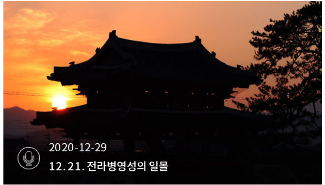
2020-12-29 12. 21. 전라병영성의 일몰