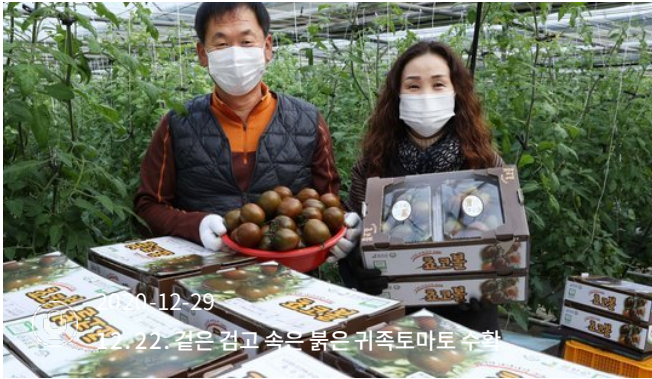
2020-12-29 12.22. 검은 겹고숙은 붉은 귀족토마토 수확