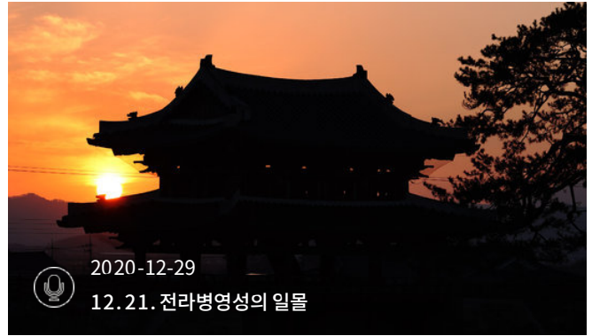
2020-12-29 12. 21. 전라병영성의 일몰