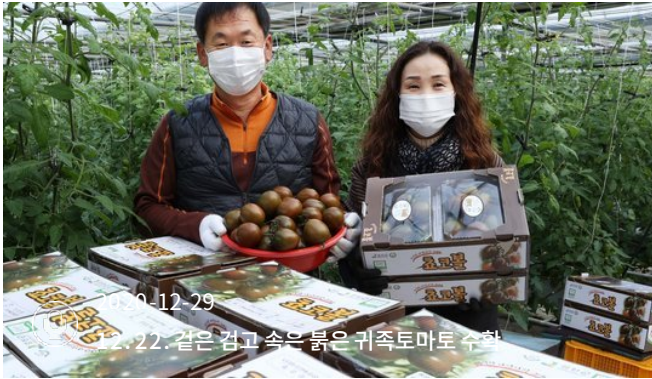
2020-12-29 12.22. 검은 겹고추는 붉은 귀족토마토 수확