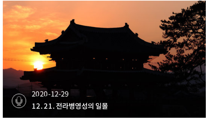
2020-12-29 12.21. 전라병영성의 일몰