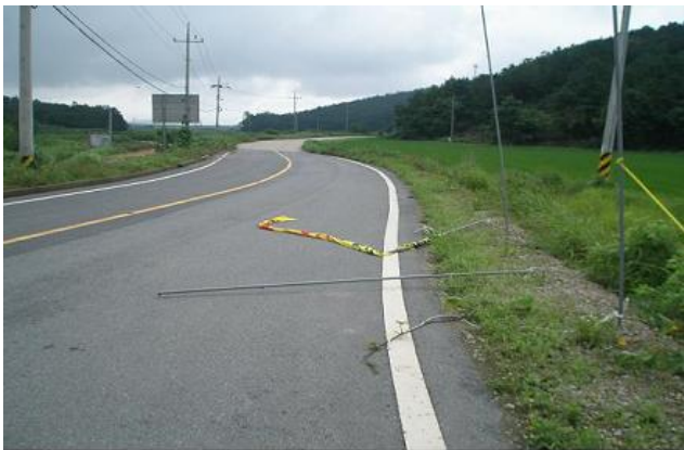
신전면 도로경관을 저해하는 폐기물 철거