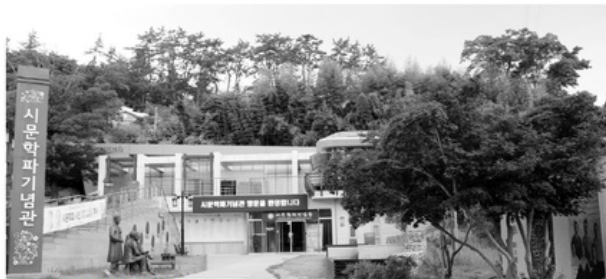
강진군 시문학파기념관 전경.

샵 252 영랑생가'는 올해 문화재청의 '2021년 고 특종갓집' 공모사업 선정에 이어 또 다시 내년 지원 사업에 선정돼 지역문화재 활용사업의 우수성을 입증했다.