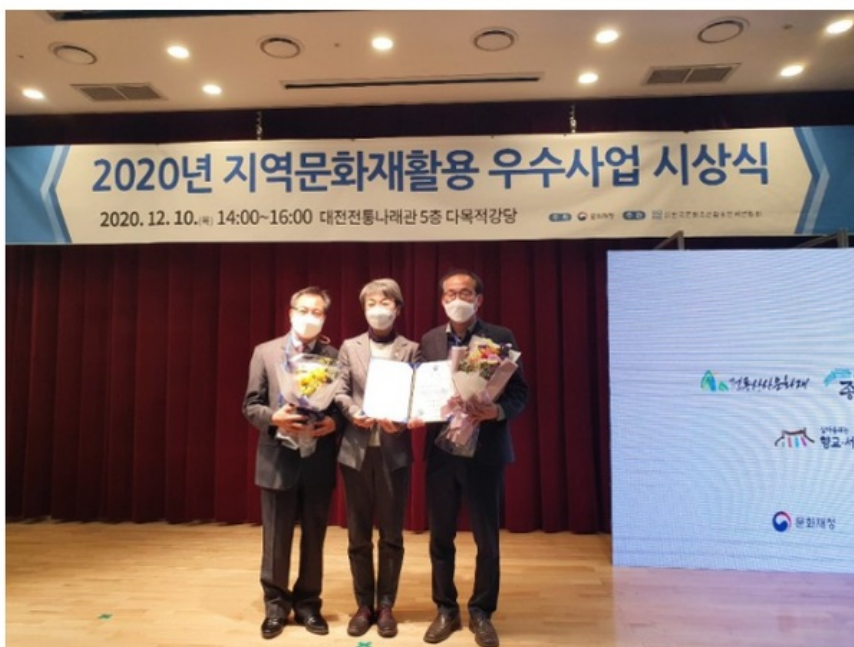
생생문화재 우수사업 선정 2020.12.10

10일 군에 따르면 시문학파기념관이 기획한 주민주도형 프로그램 '더 샵 252 영랑생가'가 전국 159개 지자체를 대상으로 한 2020년도 생생문화재 부문평가에서 강진군이 우수기관으로 선정돼 문화재청장 표창과 포상금을 받았다고 밝혔다.