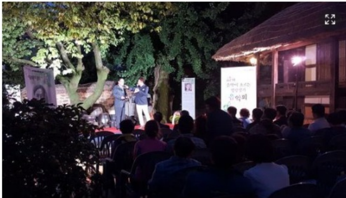
강진군 문화재활용정책'전국적 명성'

이승현 기자 kspa@kspnews.com | 기사입력 2020/09/21 [11:28]