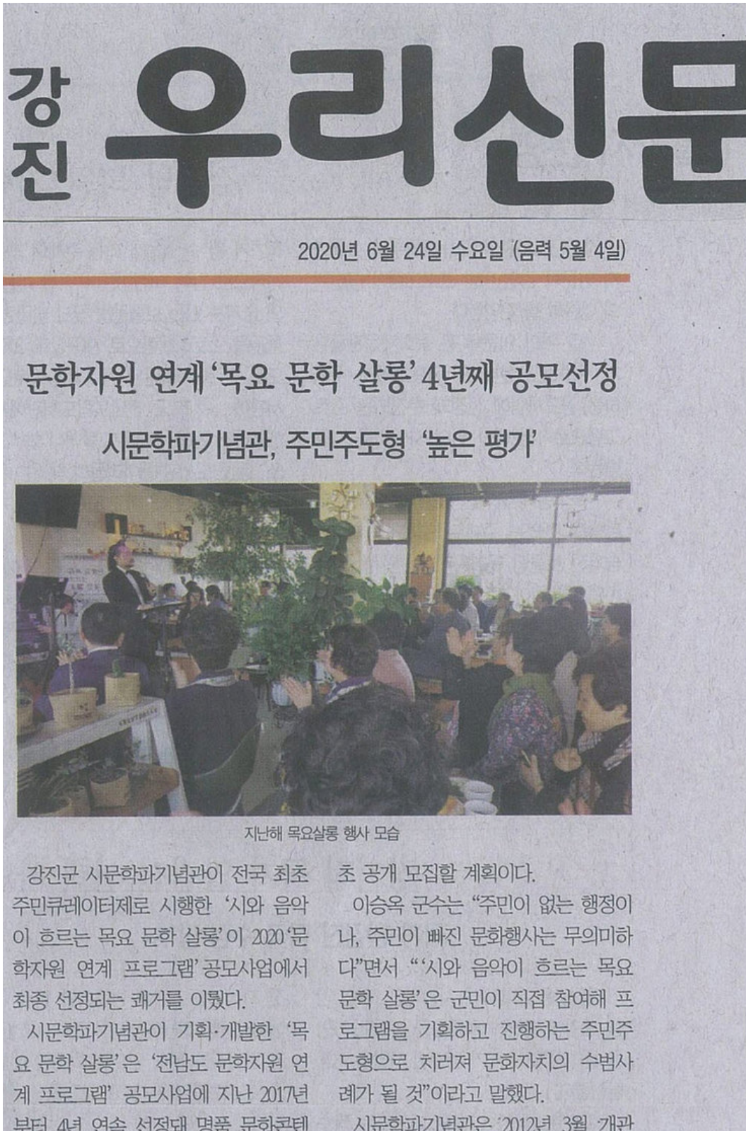
지난해 목요살롱 행사 모습

강진군 시문학과기념관이 전국 최초 주민큐레이터제로 시행한 '시와 음악이 흐르는 목요 문학 살롱'이 2020 '문학자원 연계 프로그램' 공모사업에서 최종 선정되는 쾌거를 이뤘다.