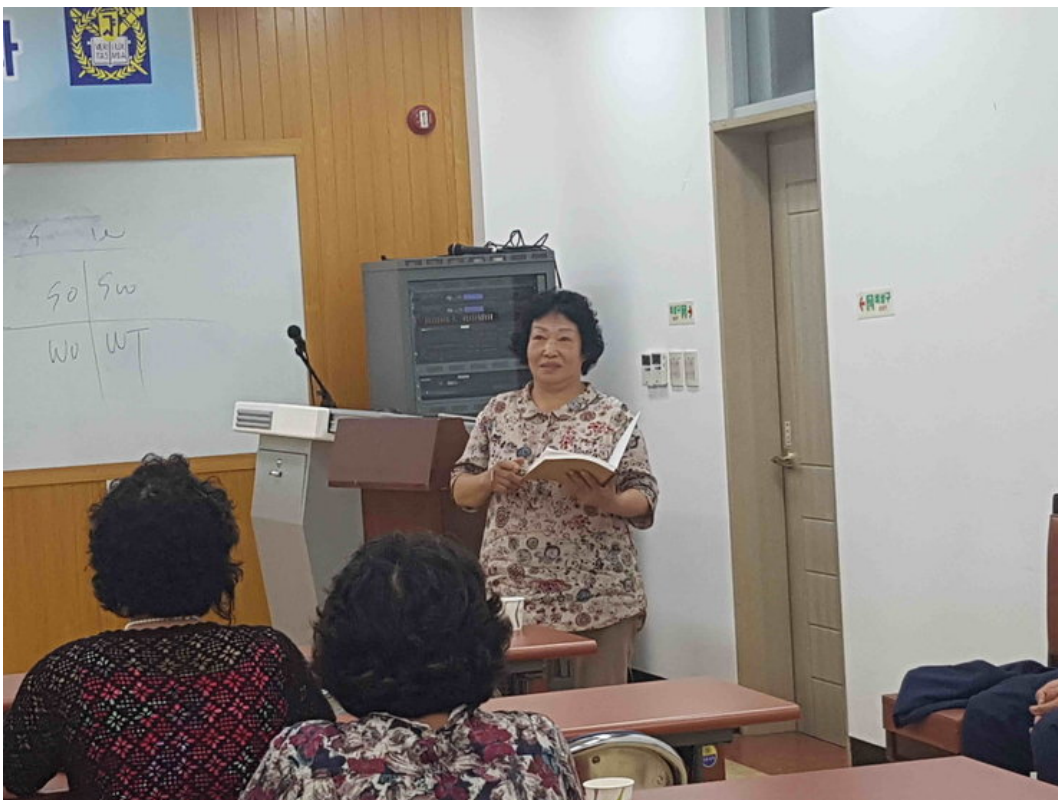
녹색문화대학 농업 CEO 대학원고과정 교육및 주제발표