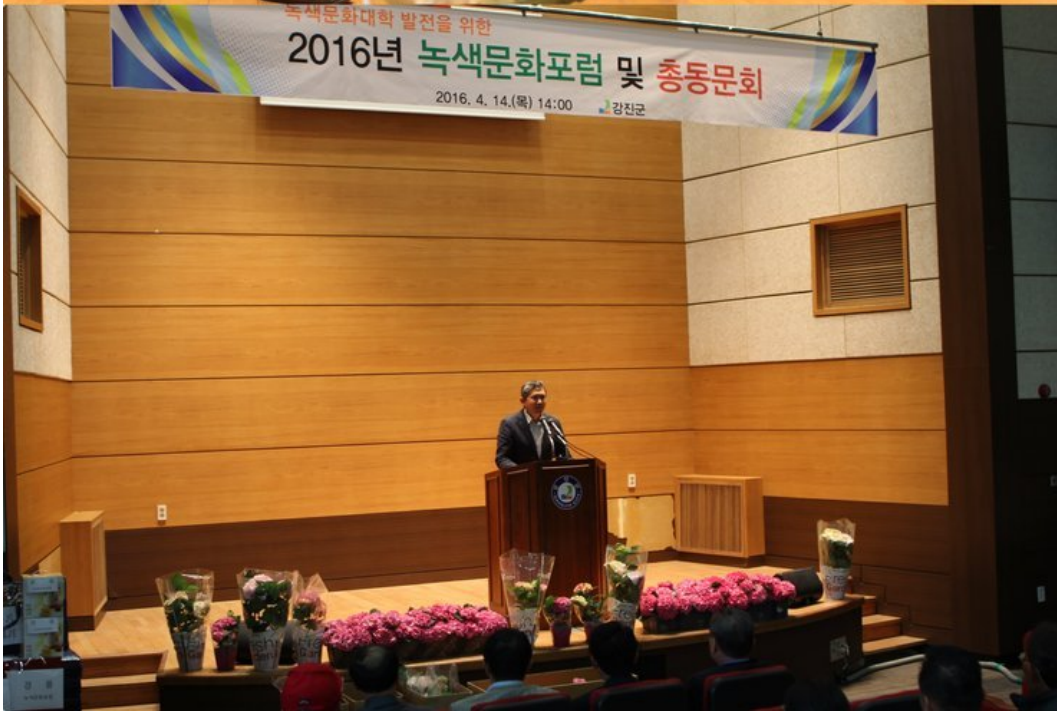
2016년도 발전방안 포럼이 농업기술센터 대강당에서 있었다. 졸업생과 재학생 등 많은 분들이 참석하여 성황리에 마무리 되었다.