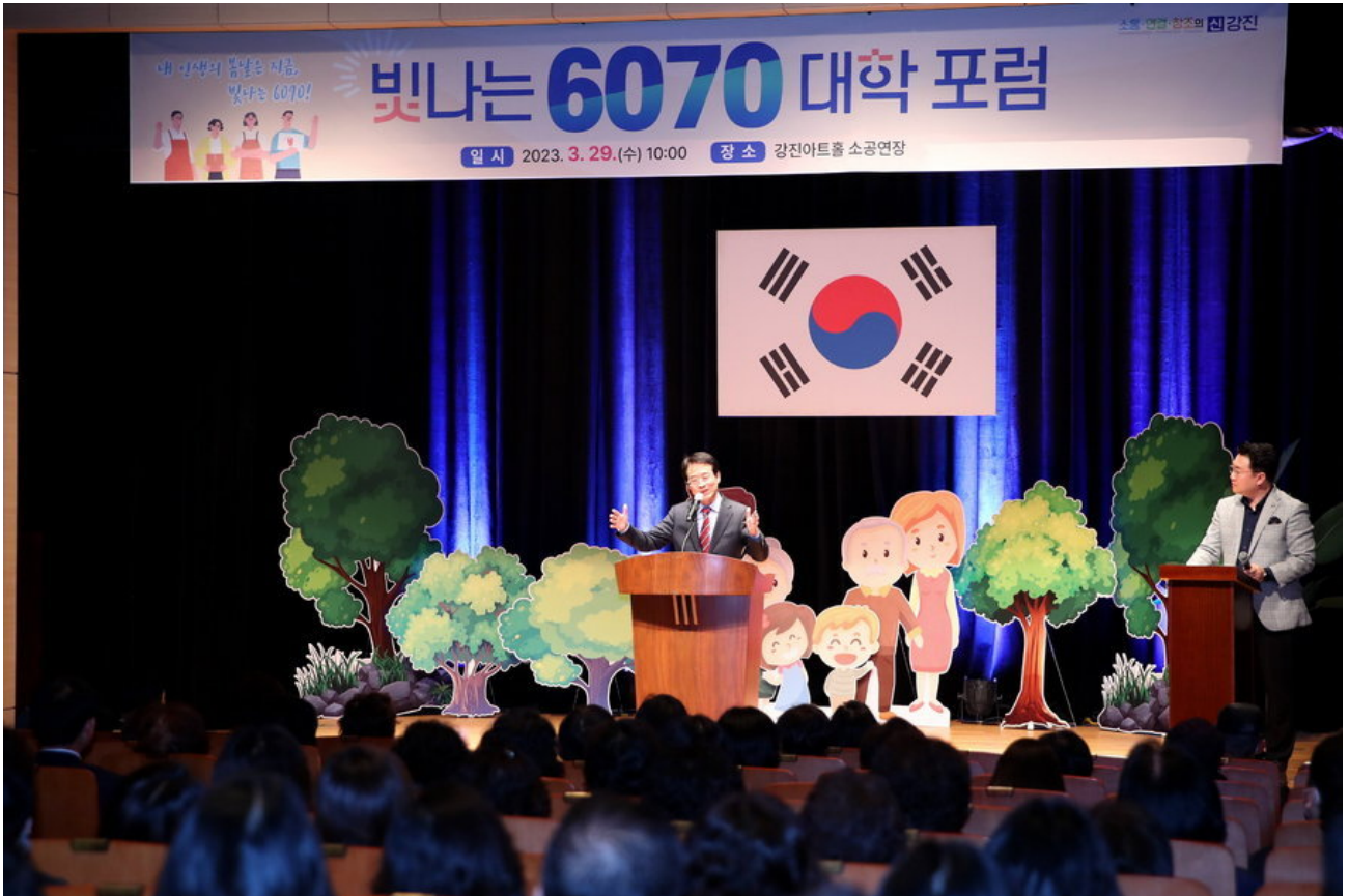
빛나는 6070 대학 포럼