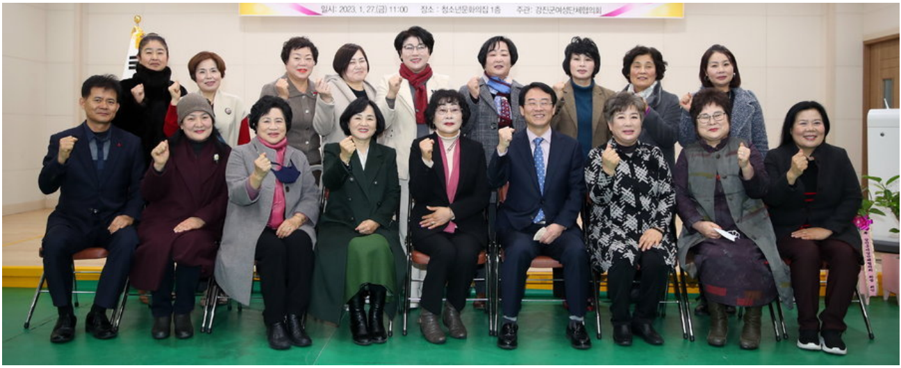
제14대 강진군여성단체협의회 이·취임식

COPYRIGHT © GANGJIN-GUN. ALL RIGHT RESERVED.