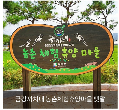
금강까치내 농촌체험휴양마을 팻말