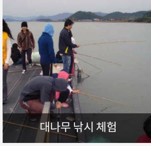
대나무 낚시 체험