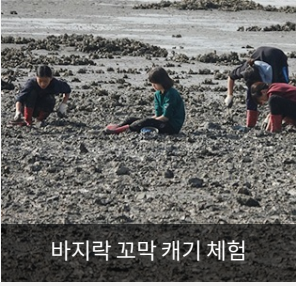
바지락 꼬막 캐기 체험