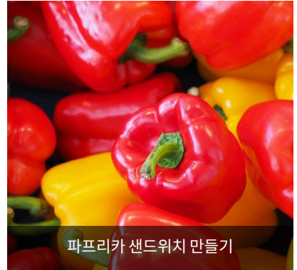
파프리카 샌드위치 만들기