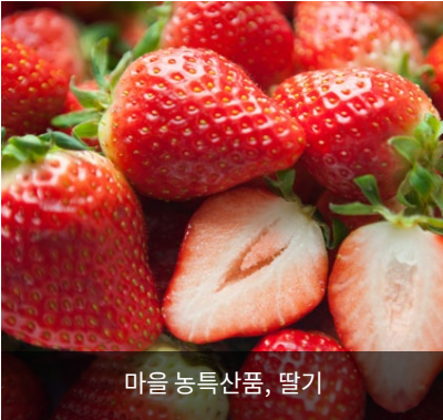
마을 농특산품, 딸기