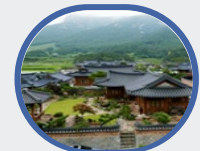
< < < < ○ 농촌민박(FUSO) 홈페이지 바로가기