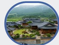
< < < < ○ 농촌민박(FUSO) 홈페이지 바로가기