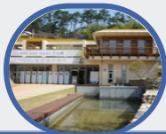
○ > > > 영랑감성학교

강진군 푸소(FU-SO)체험은 농촌의 정(情)을 바탕으로 도시민의 감성을 자극하며 농가체험을 통해 훈훈한 정과 감정을 경험하며 감성여행 1번지로 각광받고 있습니다.