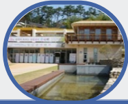
○ > > > 영랑감성학교

강진군 푸소(FU-SO)체험은 농촌의 정(情)을 바탕으로 도시민의 감성을 자극하며 농가체험을 통해 훈훈한 정과 감정을 경험하며 감성여행 1번지로 각광받고 있습니다.