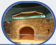
○ >>> 다산박물관

강진군 푸소(FU-SO)체험은 농촌의 정(情)을 바탕으로 도시민의 감성을 자극하며 농가체험을 통해 훈훈한 정과 감정을 경험하며 감성여행 1번지로 각광받고 있습니다.