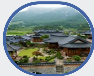
○ 농촌민박(FUSO) 홈페이지 바로가기