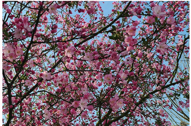
개화현황(2024. 4. 11.)