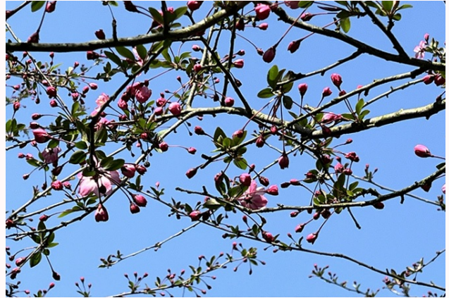
개화현황(2024. 4. 7.)