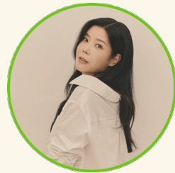
현역가왕 린 3월 30일 (토)