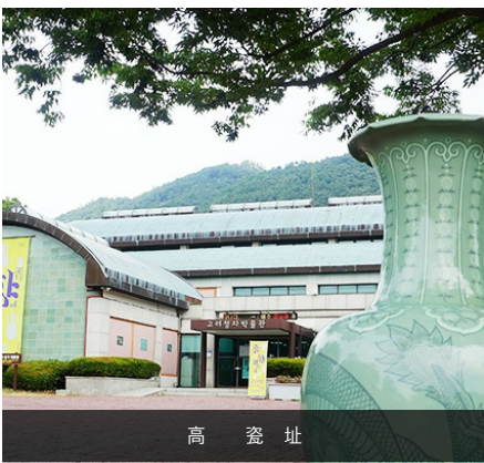
高 瓷 址