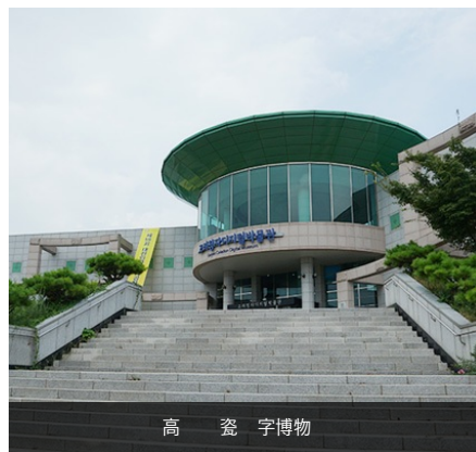
高 瓷 字博物