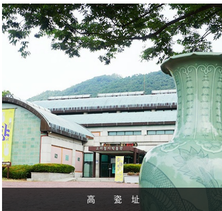
高 瓷 址